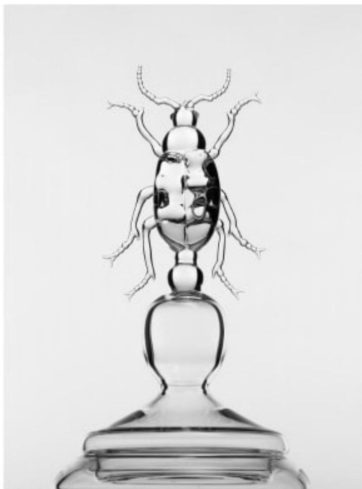
Close up of the Calosoma Sycophanta vase. Vaso Calosoma Sycophanta, particolare.