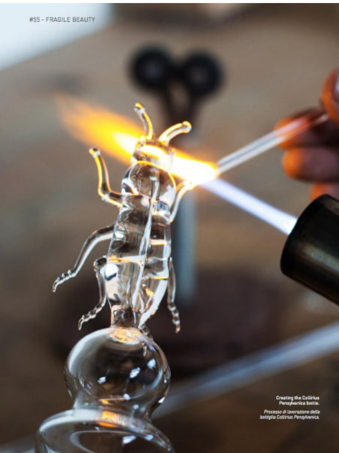
Creating the Collirius Penyhanica bottle. Processo di lavorazione della bottiglia Collirius Penyhanica.