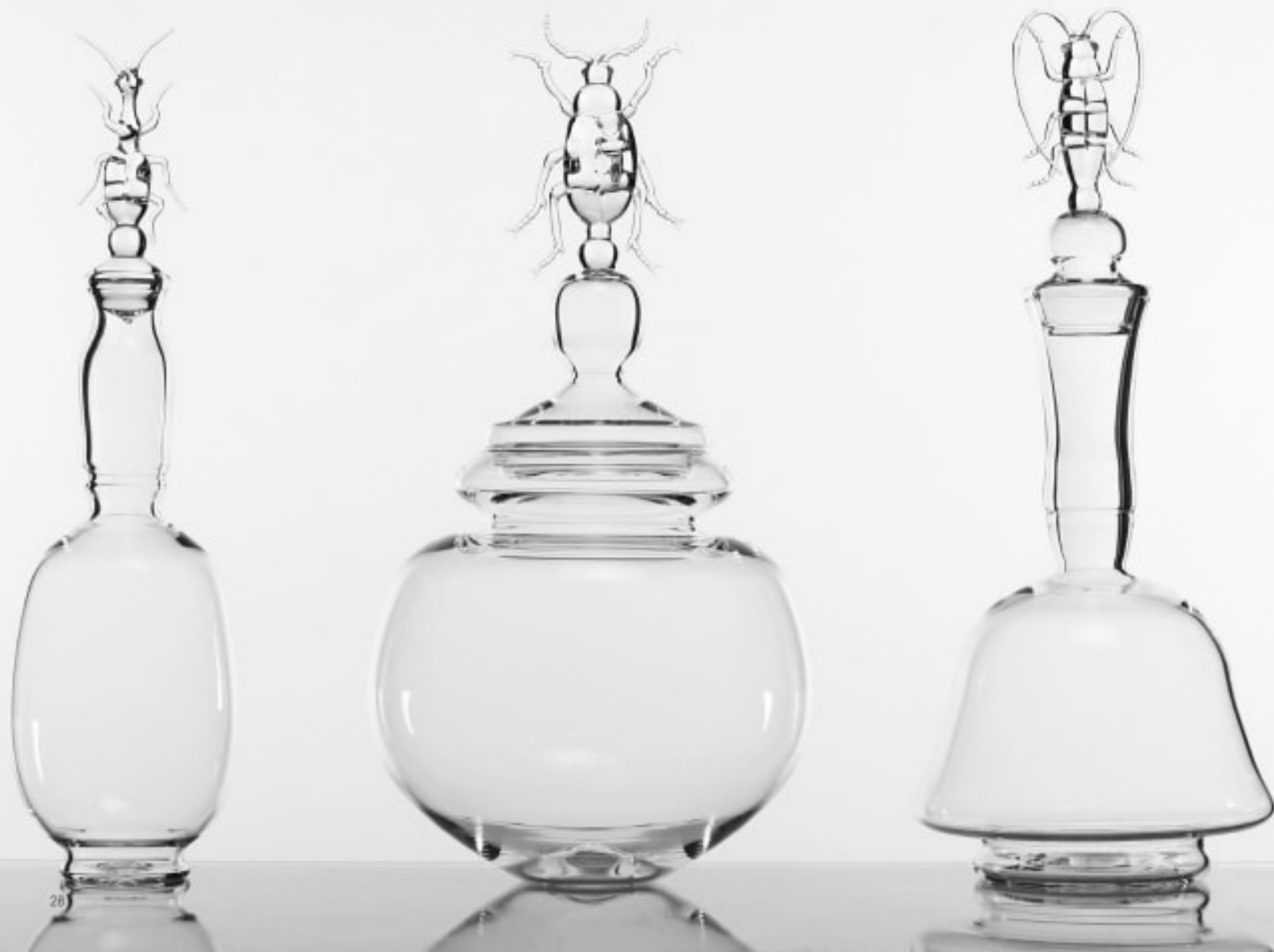
From left, Collinus Pennsylvanica , Calosoma Sycophanta vase, Stellognatha Maculata decanter. Da sinistra, bottiglia Collinus Pennsylvanica , Vaso Calosoma Sycophanta , Decanter Stellognatha Maculata .